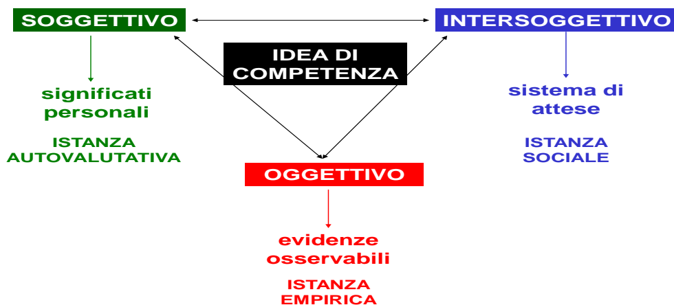
Tav. 2 Livelli di valutazione delle competenze

L' individuazione dei criteri di valutazione ci sposta al centro delle tre dimensioni, all' idea di competenza intorno a cui ruotano i diversi strumenti e punti di vista, che si struttura nella rubrica valutativa, come dispositivo attraverso il quale viene esplicitato il significato attribuito alla competenza oggetto di osservazione e precisati i livelli di padronanza attesi in rapporto a quel particolare soggetto o insieme di soggetti. Tale strumentazione costituisce il punto di riferimento comune ai diversi materiali a cui si è fatto cenno in rapporto alle tre dimensioni di analisi e assicura unitarietà e coerenza all'intero impianto di valutazione. Ciascuno degli strumenti richiamati in precedenza rappresenta idealmente una declinazione operativa, pensata in rapporto ad uno specifico soggetto e ad un determinato punto di osservazione, dell'idea di competenza condensata nella rubrica valutativa; come abbiamo già ricordato solo questa condizione giustifica e legittima l'impianto plurale di valutazione proposto.